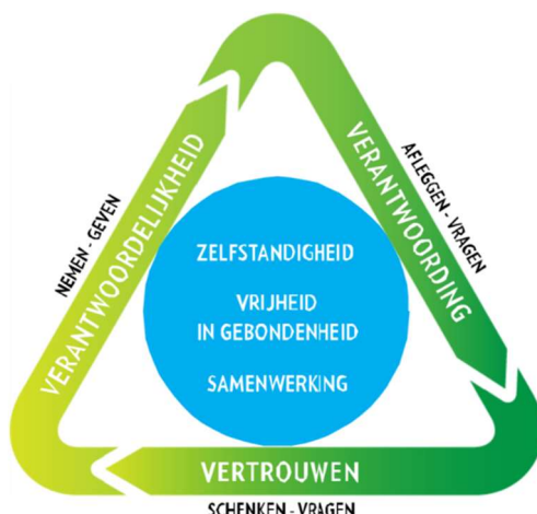
figuur 1. Daltondriehoek

De uitgangspunten van het daltononderwijs staan in de daltondriehoek, zie figuur 1.